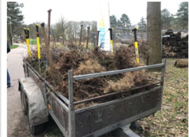
Duizenden zaailingen in de kar van MeerBomenNU, onderweg naar een nieuwe plek om uit te groeien tot een volwassen boom.

Castricum - Afgelopen donderdag heeft een groep vrijwilligers van MeerBomenNu in een bos op het terrein van Duin en Bosch 2600 zaailingen geogost om elders uit te planten. Het terrein werd ter beschikking gesteld door de Parnassia Groep. In het bos stond een overdaad aan zaailingen van bijvoorbeeld kardinaalsmuts, Europese vogelkers, zomereik, ribes en meidoorn. Deze zaailingen hebben in het bos geen kans om uit te groeien tot een volwassen bos of struik.