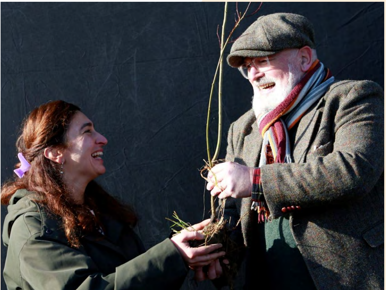
Eurocommissaris Timmermans en Vlaams minister Demir verplanten eerste Belgische zaailing.

Opschot dat op de ene plek ongewenst is en wordt verwijderd en versnipperd, wil een ander misschien wel heel graag planten. Door anders naar de natuur te kijken en de bosmaaier in de kast te laten, proberen wij Nederland sneller en goedkoper te vergroenen en zo klimaatverandering te remmen en biodiversiteit te herstellen. Deze methode is onbeperkt schaalbaar, en trekt inmiddels behalve Nederlandse ook al veel buitenlandse ogen .