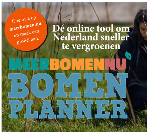
Bomenplanner Meer Bomen Nu